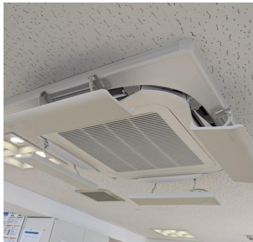
事務所エアコンの買い替え