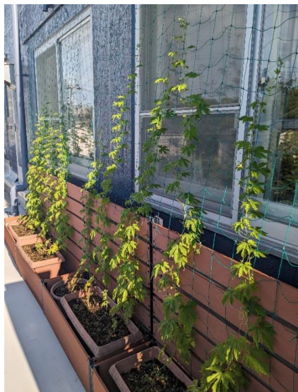
省エネグリーンカーテン